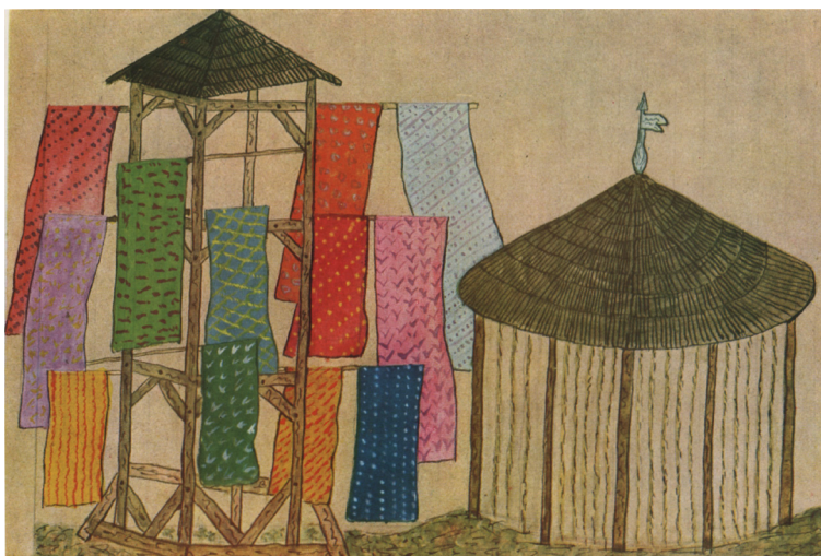
Sušárna na kartouny