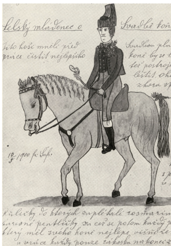
Ilustrace mládence o svatbě