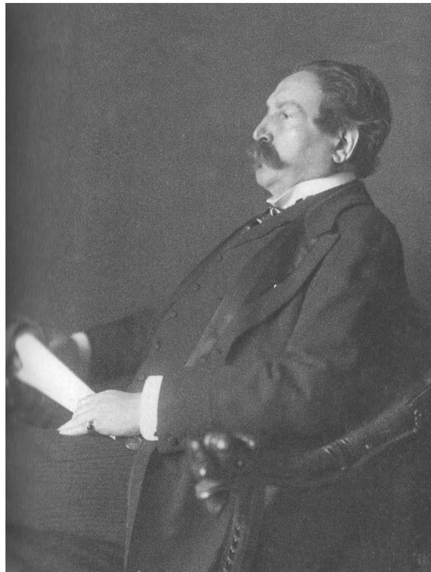
Obr. 4 Angelo Neumann