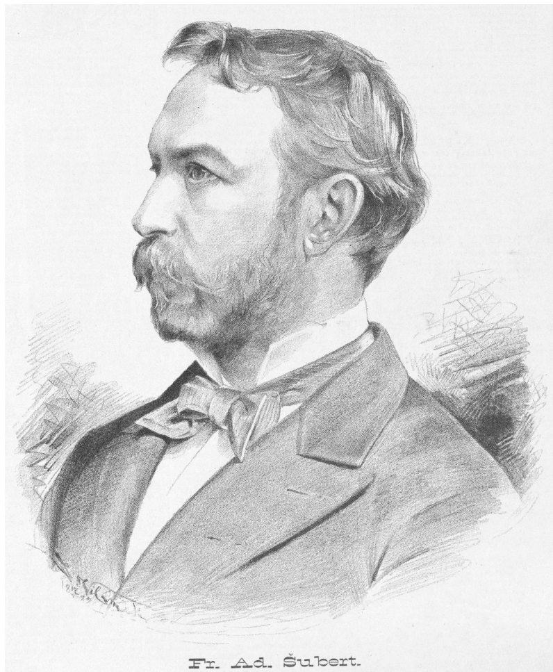
Obr. 5 František A. Šubert, kresba Jan Vilímek, 1882.