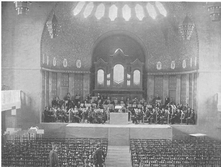
Obr. 7 Koncertní pavilon na Jubilejní výstavě roku 1908 v Praze, navržený architektem Josefem Záschem.