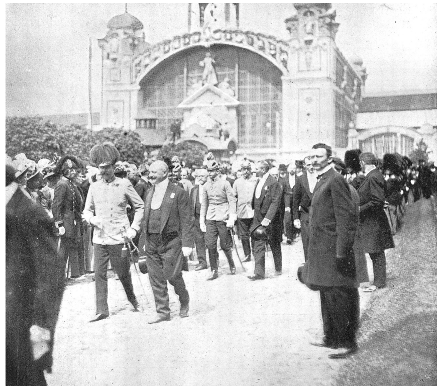
Obr. 6 Velkovévoda František Ferdinand při otevření Jubilejní výstavy v Praze, 14. dubna 1908.