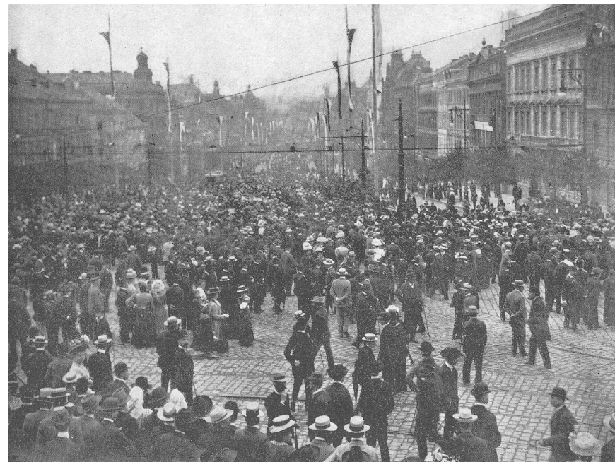
Obr. 1 Demonstrace za české menšinové školy na Václavském náměstí dne 9. srpna 1908.

(překlad z anglického originálu: Hynek Zlatník)