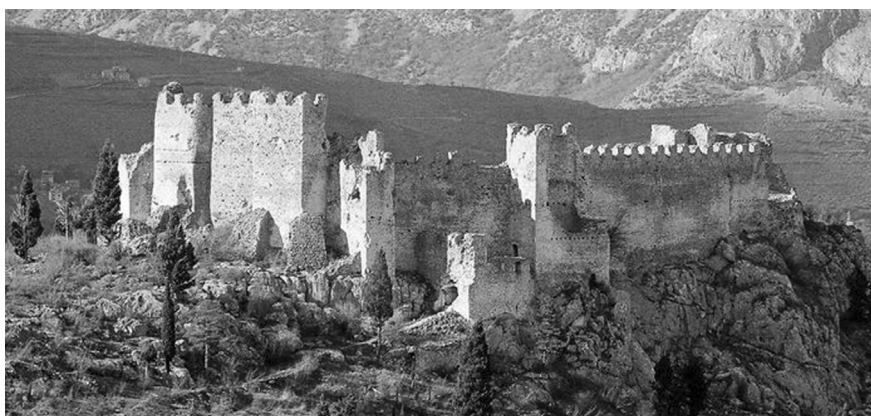
Hrad Ljubuški v Hercegovině