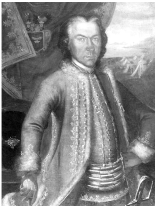
Franz Leopold von Czungenberg (Zungaberg)