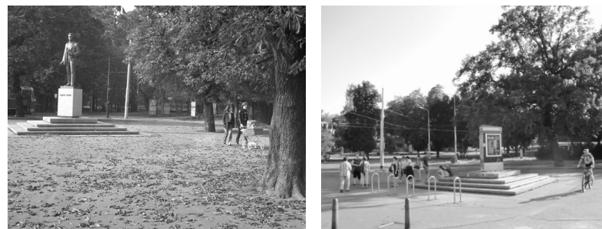
Obrázek 4: Změna veřejného prostoru. Umístění pomníku Julia Fučíka před výstavištěm v Holešovicích. Vlevo fotografie z roku 1979, vpravo současný stav.

Vytyčené didaktické cíle tak představují spojnici mezi prací s relikty minulosti a přítomností skrze kompetence mediální gramotnosti. Schopnost reflexe různého druhu vystavování v rozličných kontextech a místech (od ulice až po muzeum) je budována v rámci interpretačních her zakotvených v minulosti československého socialismu. Skrze poznání forem, obsahu a metod sebe prezentace KSČ se tak žák učí porozumět minulosti stejně jako jejím ozvěnám v současnosti.