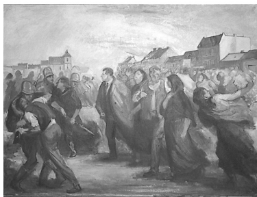
Menšík, V.: Gottwald v čele stávkových hornických žen, olej na plátně, 50. léta

„Nedávno jsme našli ve starých archívech ministerstva vnitra konfiskovanou zprávu z rudého večerníku o tom, jak četníci v červenci 1930 zkrvavili bajonetem tvář poslance Gottwalda, který vedl hornickou demonstraci. To je velmi výmluvný doklad o tom, že Klement Gottwald nedělá nikdy politiku z okna kanceláře, nýbrž tam, na bojišti v čele pracujícího lidu. Své zocelení, svou pevnost a rozhodnost osvědčil Klement Gottwald i při řízení našeho odboje proti německým okupantům. A ve skvělém lesku viděli jsme tyto jeho vůdcovské vlastnosti v letošním únoru...Gottwald má nejenom dálnovidné a ostrážité orlí oko, ale i lví spár – revoluční odvahu a smélost.“