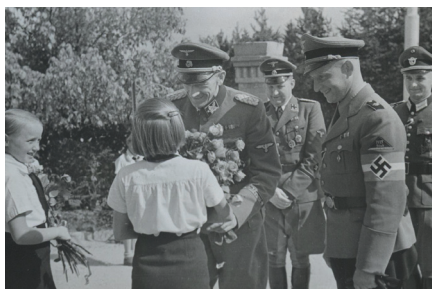
Návštěva státního tajemníka K. H. Franka v táboře KLV v Jílovíšti u Prahy, červenec 1942 (sign. 109-18/4)