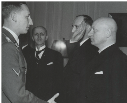
Přijetí členů nově jmenované protektorátní vlády s jejím předsedou Jaroslavem Krejčím zastupujícím říšským protektorem Reinhardem Heydrichem v lednu 1942 (sign. 109-4/203)