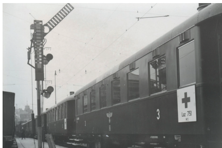
Sestavení a vybavení lazaretního vlaku v protektorátu jako daru protektorátní vlády Adolfu Hitlerovi k jeho narozeninám, 1942 (sign. 109-7/14)