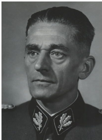
Portrétní foto státního tajemníka u říšského protektora Karla Hermann Franka, září 1941 (sign. 109-12/143)