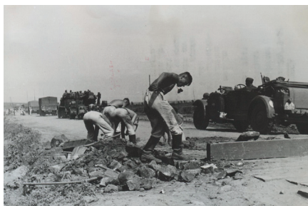
Pracovní nasazení příslušníků RAD při úpravě cest pro vojenské transporty, 1941 (sign. 109-7/107)