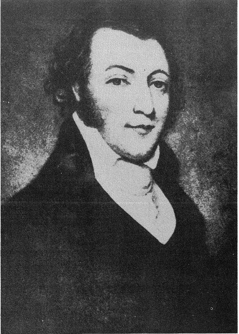
William James MacNeven, M.D. (1763-1841)