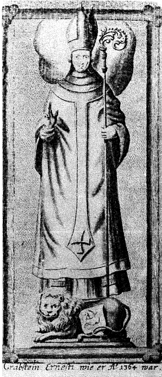
Grabstein Ernests wie er A° 1564 war.