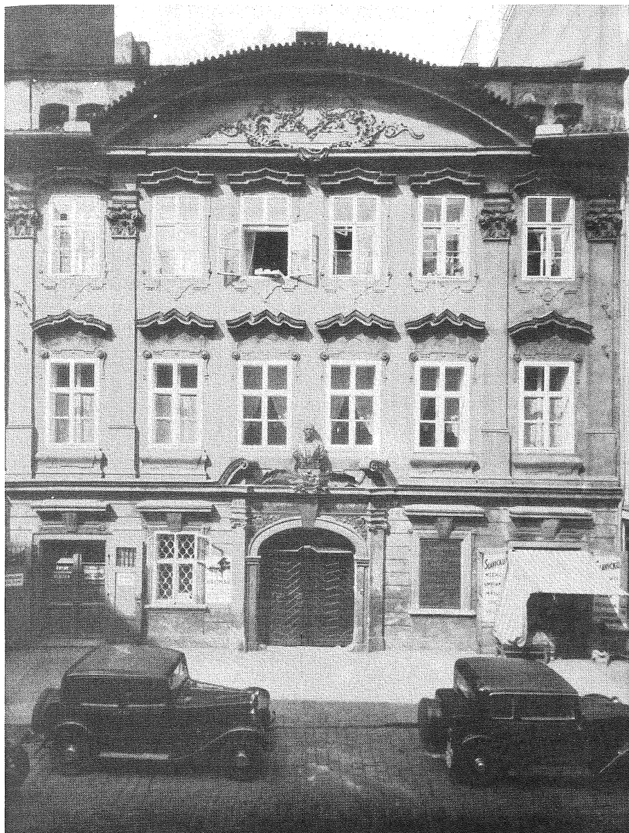
Dům č. 719 ( původně 508 ) v bývalé ulici Pasířské nyní ul. Palackého ( nové čís. domu 7. ) - v němž od roku 1750 bydlel Wilhelm Mac Neven .