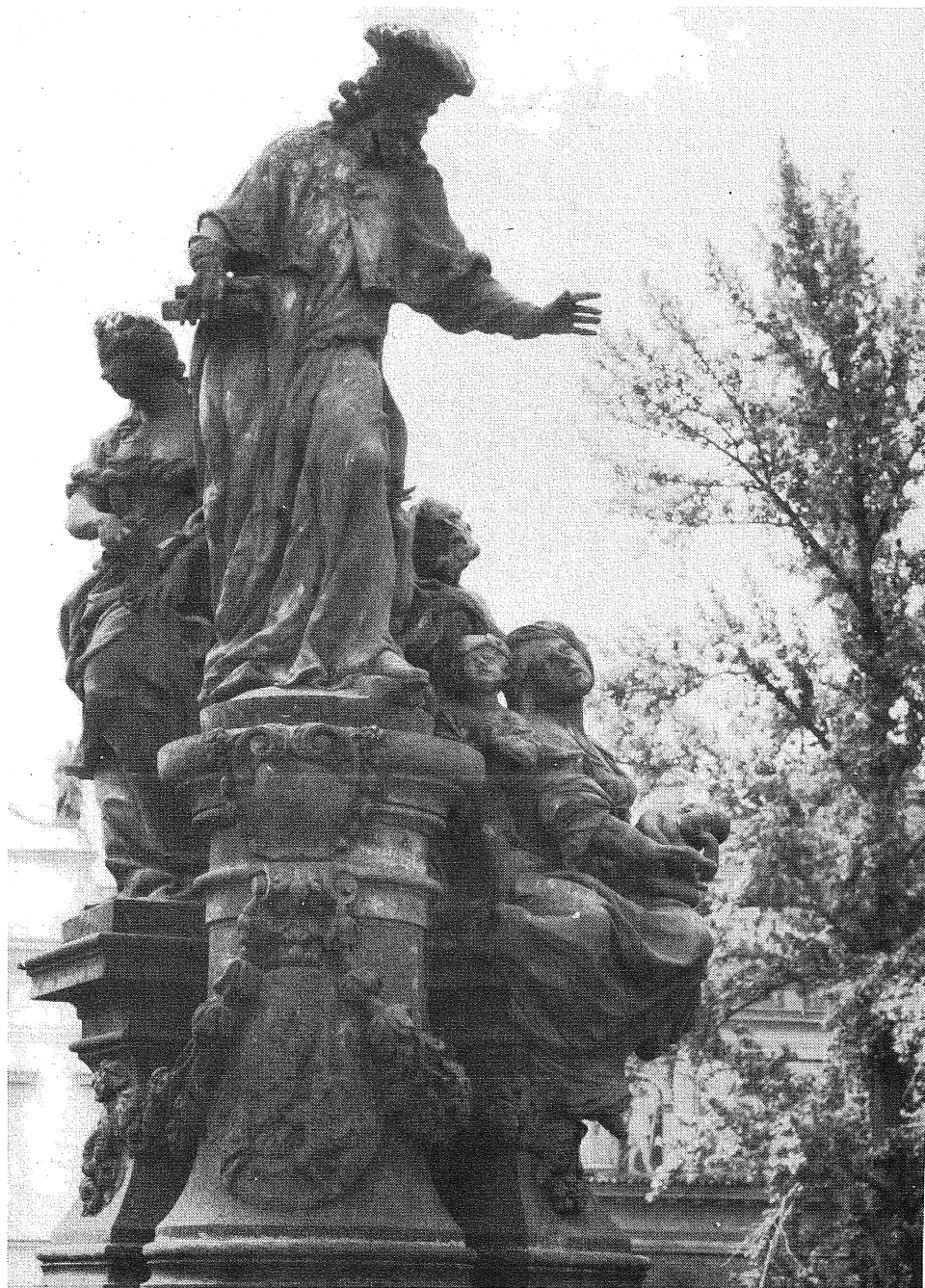
Sousoší sv. Iva na Karlově mostě